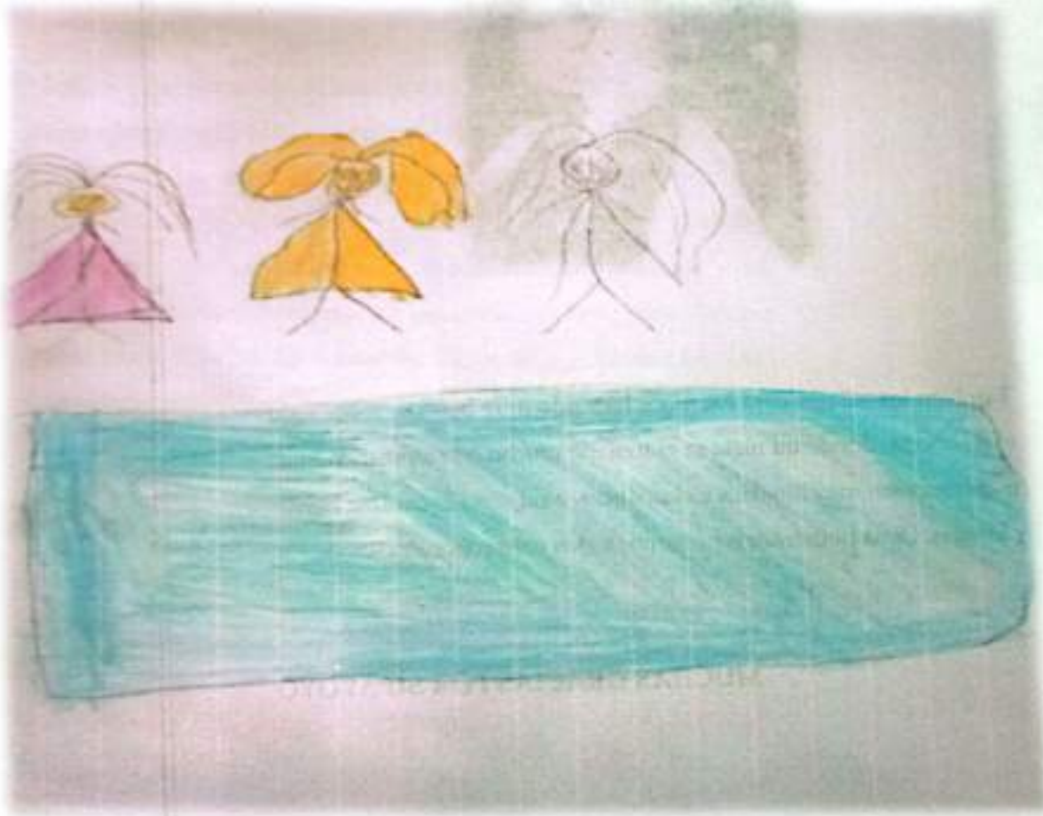
A bigail Armijo Arriagada, 6 años, comuna Pudahuel.